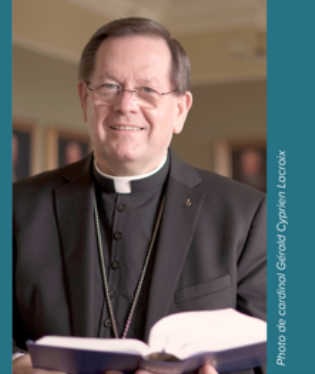
Photo de cardinal Gérald Cyprien Lacroix

Centre Culture et Foi Le Montmartre 1669, chemin Saint-Louis, Québec G1S 1G5 Entrée libre. Bienvenue à chacun et chacune !